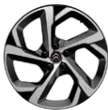
Lichtmetaal 18" SWIRL TWO TONE 225/55 R18