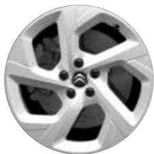
Lichtmetaal 18" SWIRL 225/55 R18