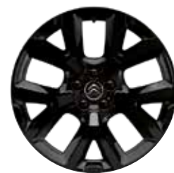
Lichtmetaal 19" ART Black 205/55 R19