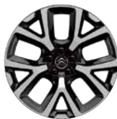
Lichtmetaal 19" ART 205/55 R19